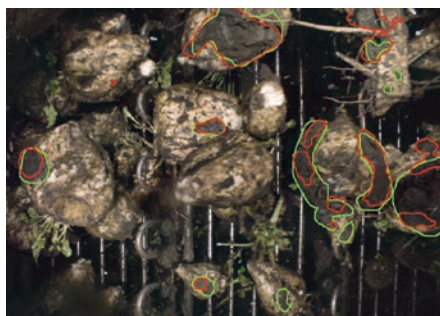
■ Abb. 3: Segmentierung von Merkmalen auf Zuckerrüben via DL.

Käseblöcke werden in vakuumierten Schlauchbeuteln verpackt. Diese Verpackungen können undicht sein. Man erkennt dies daran, dass in einer dichten Verpackung die Folie auf der Oberfläche des Käses liegt und die Unebenheiten der Käseoberfläche sich in Form von Falten auf der Folie zeigen. Sobald Luft zwischen der Käseoberfläche und der Folie eingeschlossen ist, sind diese Falten weniger erkennbar. Durch spezielle Beleuchtungstechniken kann dieser Faltenwurf sichtbar gemacht werden, um eine