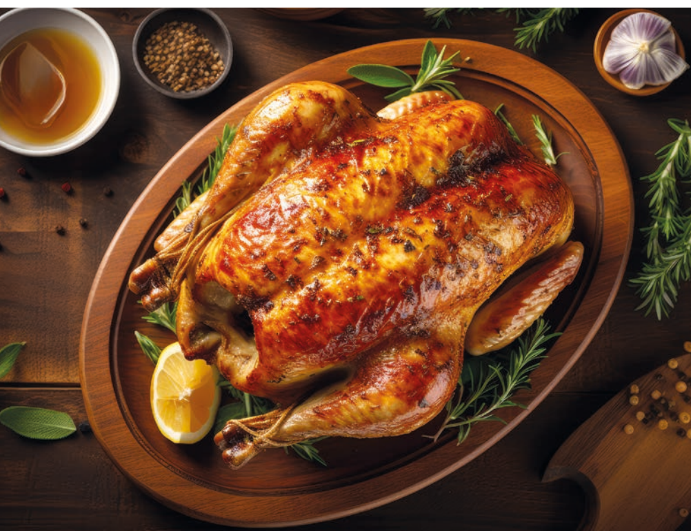
■ Abb. 1: Bei Masthähnchen oder Hähnchenteilen erlaubt die präzise Gewichtsbestimmung am Anfang der Schlachtlinie eine optimierte Steuerung von Produktions- und Verpackungsprozessen.

Zuerst sollten wir die beiden größten Herausforderungen beleuchten: die aufwendige Erstellung von geeigneten Trainingsdaten für DL-Systeme und die problematische Wartung solcher Systeme. Danach werden wir mögliche Lösungsansätze betrachten, die es ermöglichen, Projekte umzusetzen, die bisher kaum denkbar waren und eine schnellere Entwicklung von effizienteren und nachhaltigeren Lösungen in Aussicht stellen.